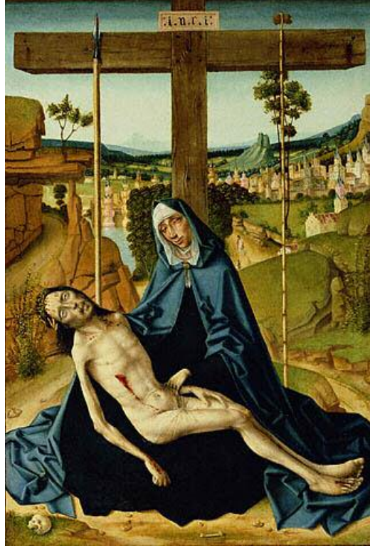
فرناندو گالیمجۆ Fernando Gallego